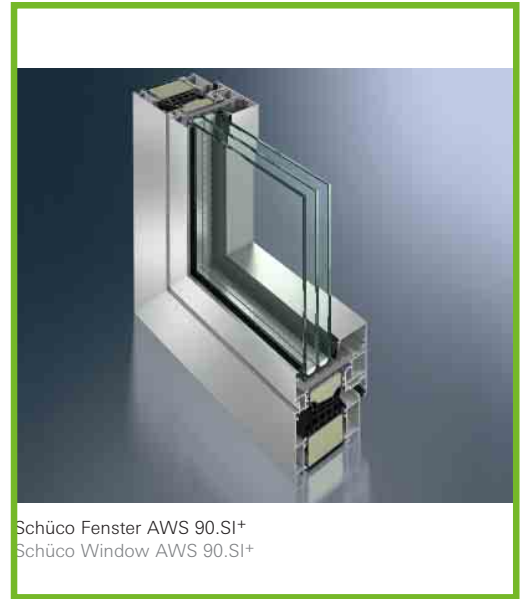
Schüco Fenster AWS 90.SI+ Schüco Window AWS 90.SI+