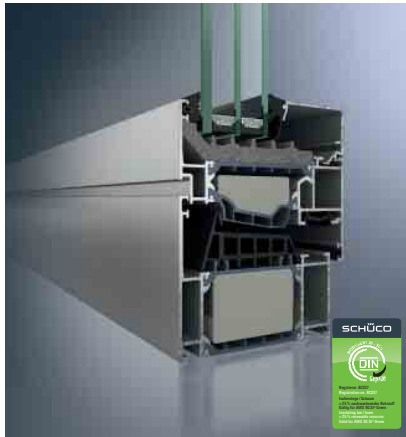
Schüco Fenster AWS 90.SI+ Green Schüco Window AWS 90.SI+ Green