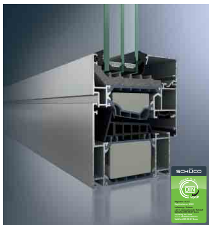
Schüco Fenster AWS 90.SI+ Green Schüco Window AWS 90.SI+ Green