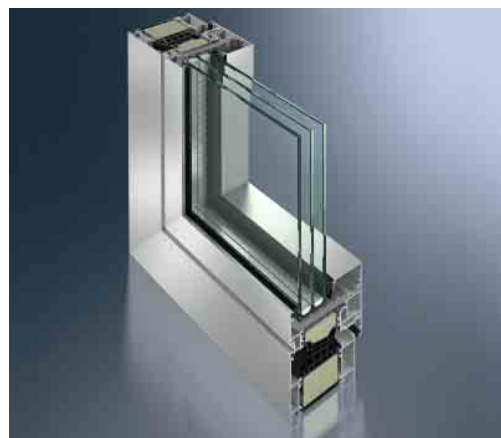
Schüco Fenster AWS 90.SI+ Schüco Window AWS 90.SI+