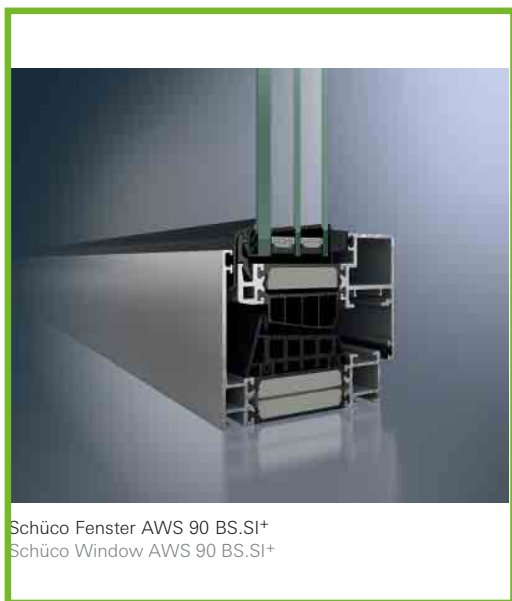
Schüco Fenster AWS 90 BS.SI+ Schüco Window AWS 90 BS.SI+