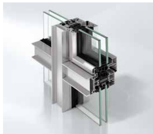
Schüco Fenster AWS 75 WF.SI+ Schüco Window AWS 75 WF.SI+