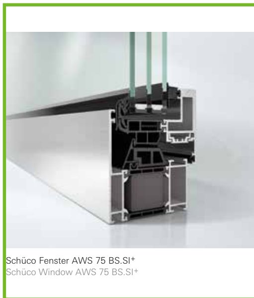
Schüco Fenster AWS 75 BS.SI+ Schüco Window AWS 75 BS.SI+